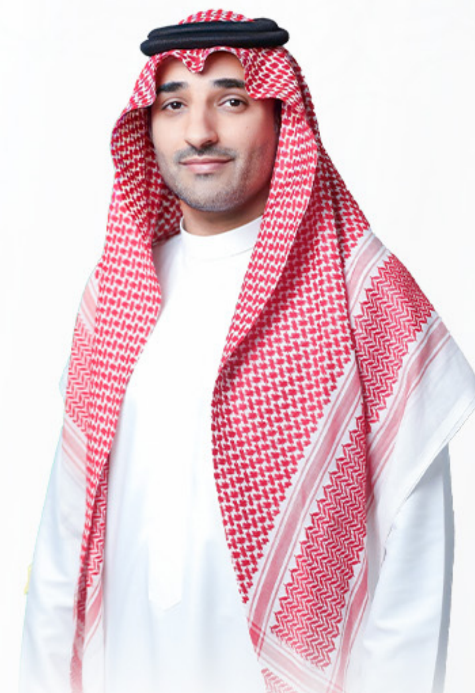
م.بندر بن مدرك الصيعري نائب الرئيس