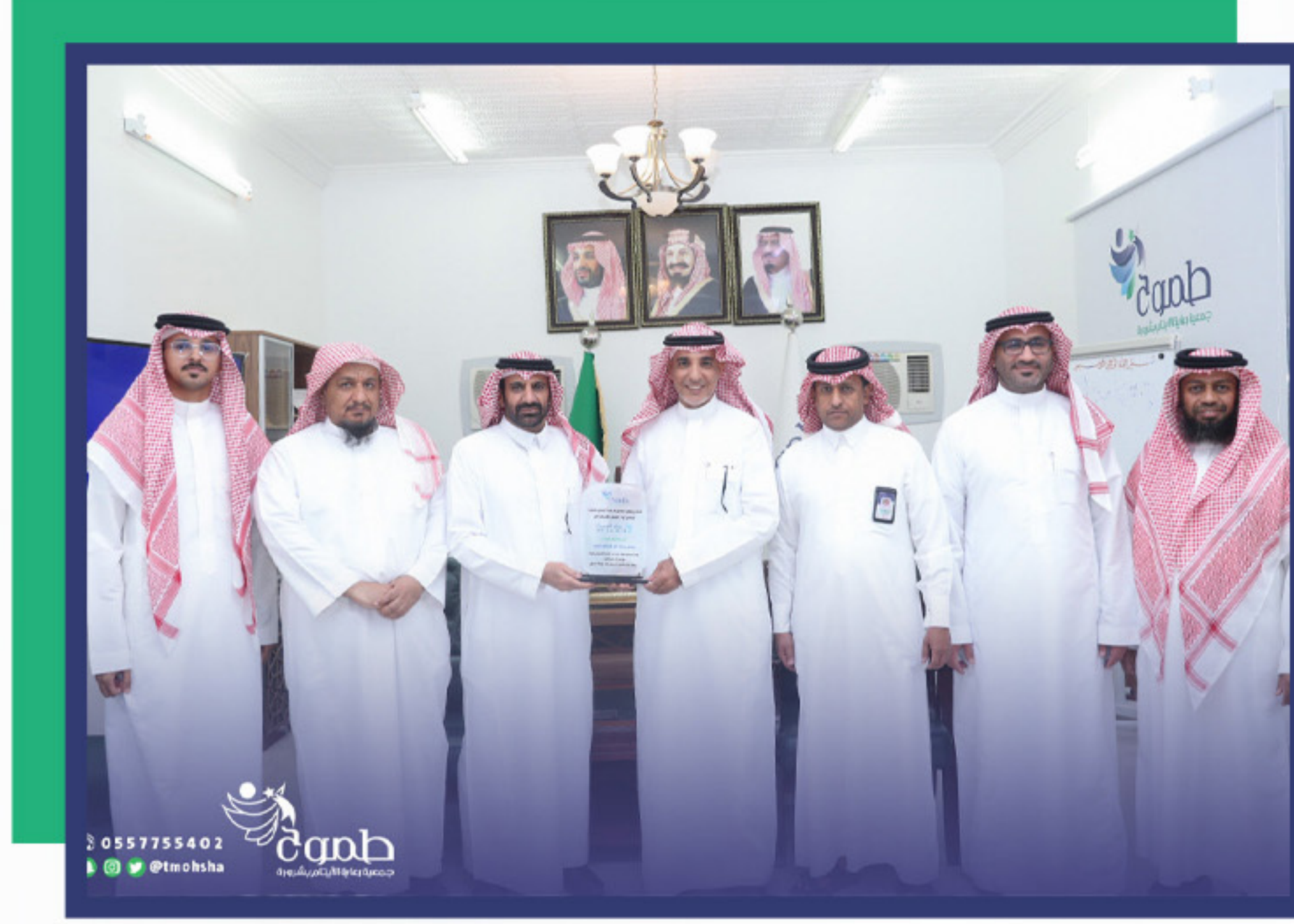
زيارة وفد بنك الجزيرة