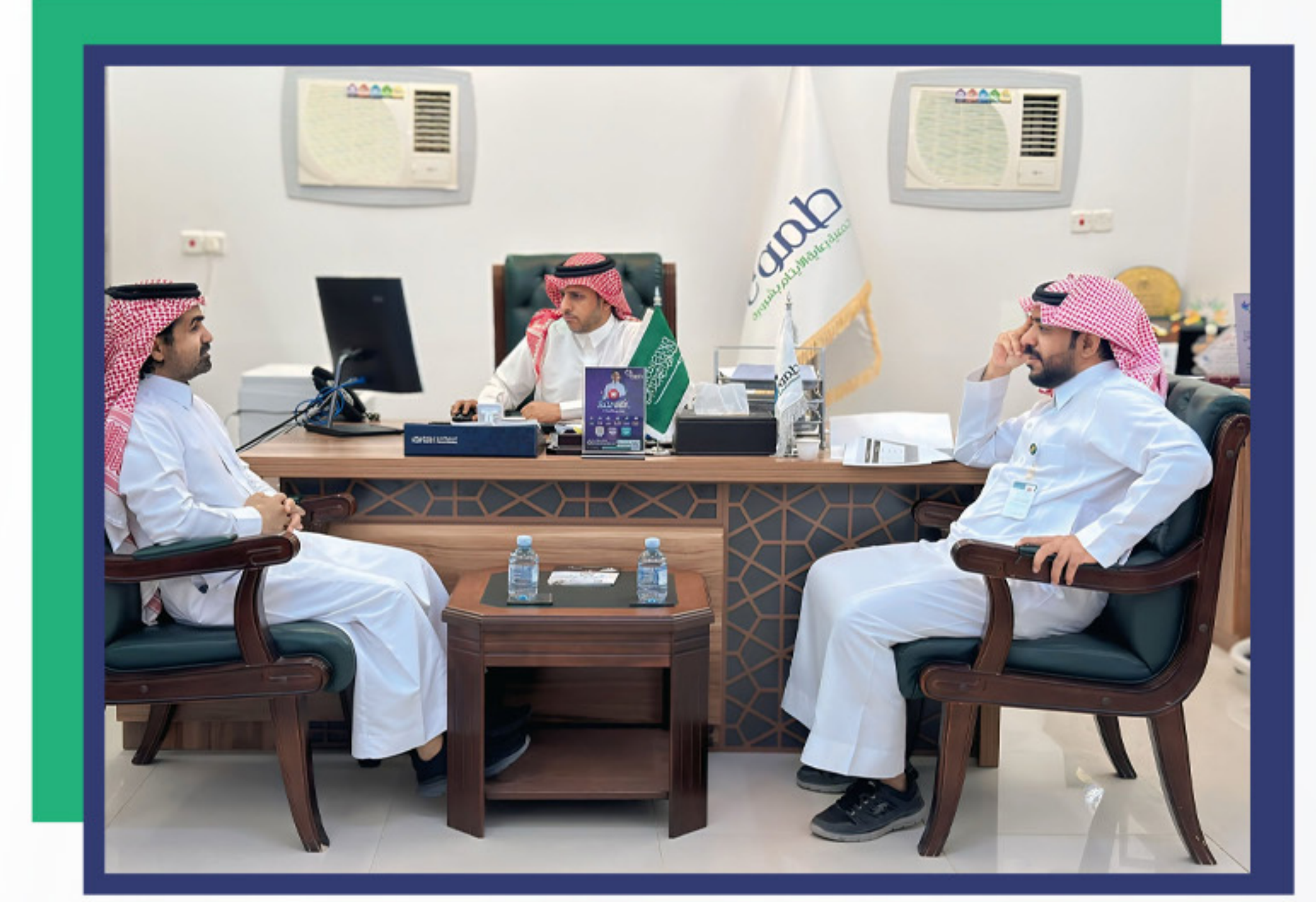
زيارة مركز التنمية الاجتماعية بشرة