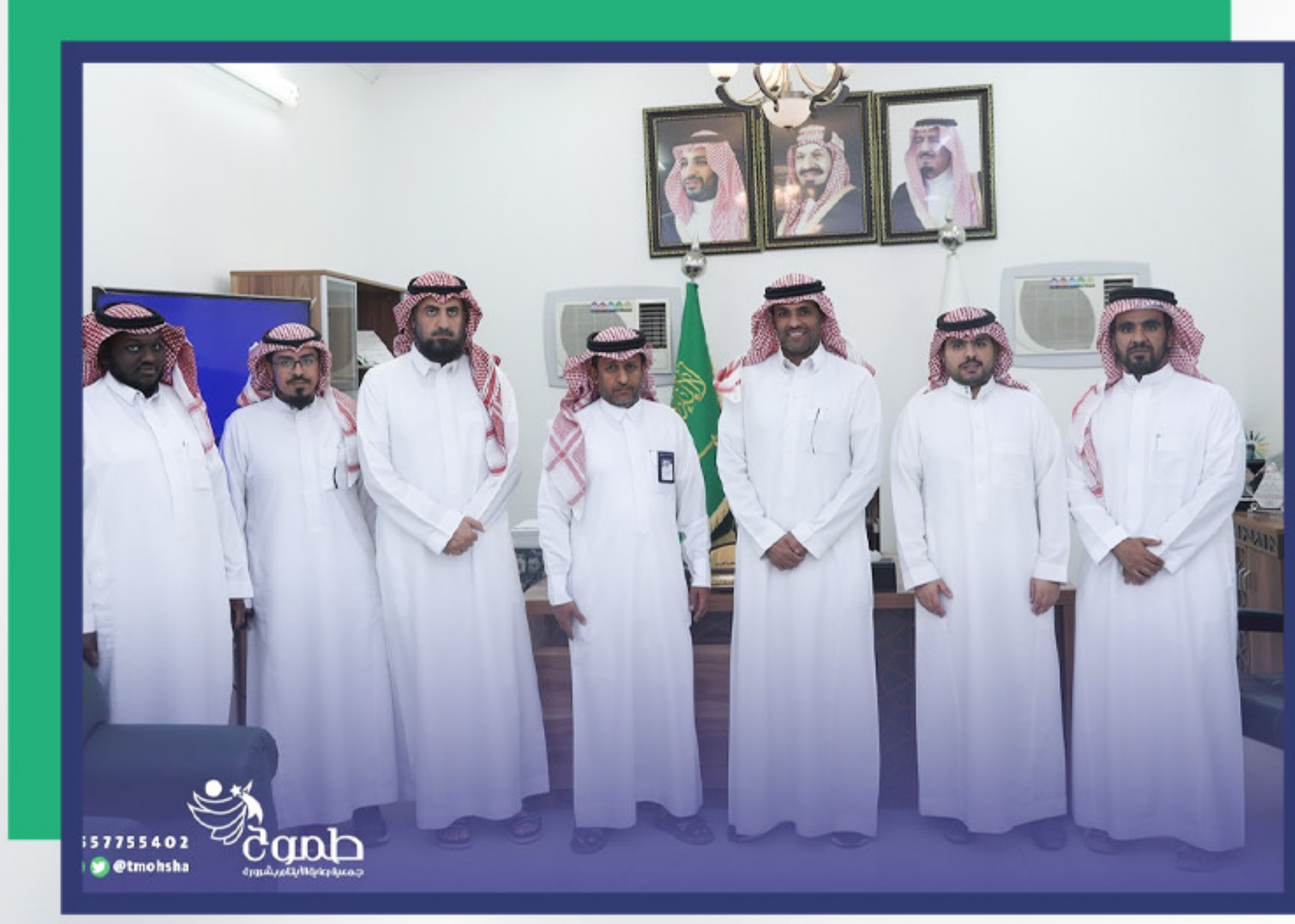
زيارة وفد مؤسسة العضبي الخيرية