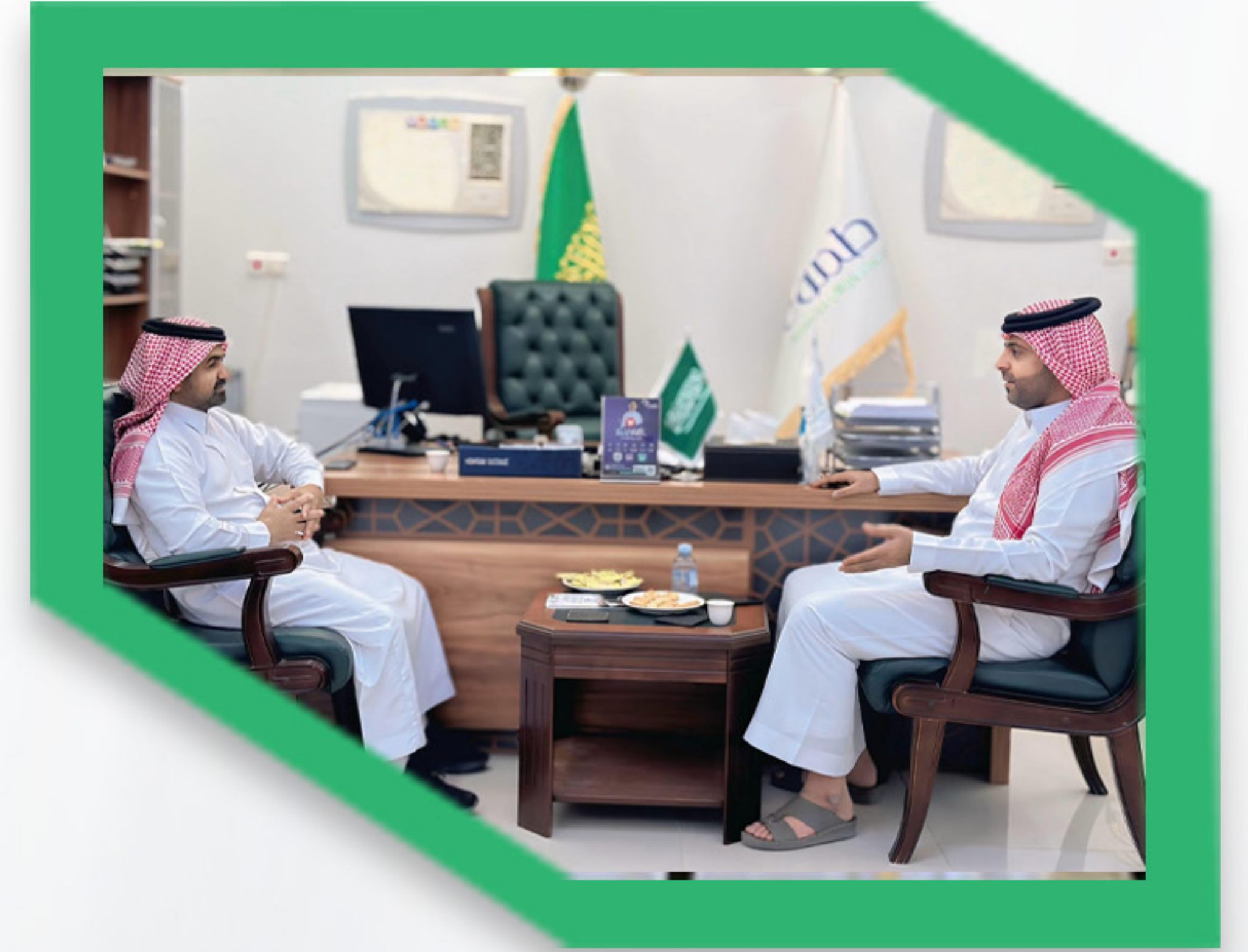
زيارة عميد فرع الكلية التقنية بشرة